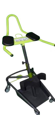
SIGO EVOL AM / SYGOSSEO AM

L'appui monobloc moustache permet quant à lui une verticalisation sécurisée en verrouillant les jambes de la personne afin d'éviter l'abduction ou l'adduction ■