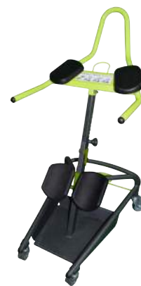
SIGO EVOL ADL / SYGOSSEO ADL

VISIONNEZ NOS VIDÉOS SUR LA CHAÎNE ALTER ECO SANTÉ