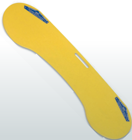
PLANCHE DE TRANSFERT