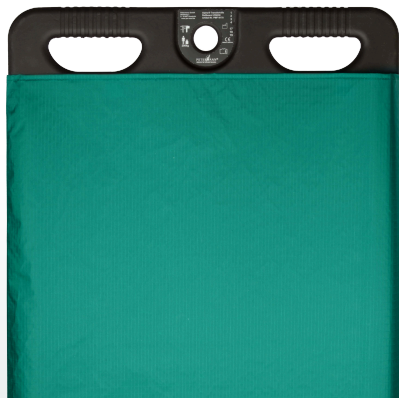
Housse textile de rechange pour planches ROLLING VISION®

Refs : SIPMF9086/96 / SIPMF9151 / SIPMF9171 / SIPMF9181