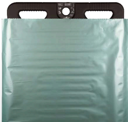
Housse PEM à usage unique pour planches ROLLING VISION®

Refs : SIPMF9090 / SIPMF9152 / SIPMF9172