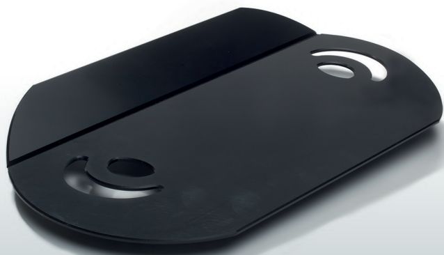
PLANCHE DE TRANSFERT ARTICULÉE