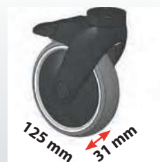
Visuels non contractuels